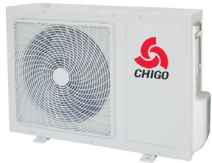
2,5kW - 3,5kW