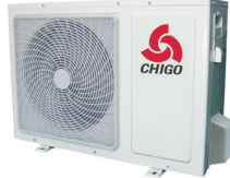
5kW - 6,1kW